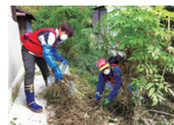
令和元年東日本台風

カナダで始まったいじめ反対運動の「ピンクシャツデー」に賛同し、2月第4水曜日を含めた1か月間、様々な啓発活動を実施しています。ピンクのTシャツや小物を身につけて、いじめのない世界の実現を呼びかけています。