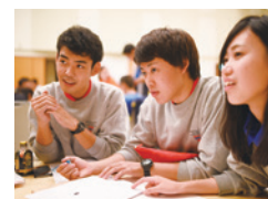
全国リーダー研修会

発達課題などにより、本来の力が十分に発揮できなかったり経験不足であったりする子どもたちの学びの場、体験の場を提供します。doing(行為)ばかりにとらわれず、一人ひとりのbeing(存在)が大切にされる地域社会を目指しています。