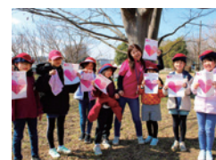
ピンクシャツデー

異文化との出会いを通して「平和を作り出す」人材として成長することを願い、世界各YMCAと協力して国際プログラムを実施しています。 パートナーシップ/米国オレゴン州：キャンピング・フィリピン共和国：パンガシナンYMCA