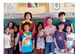
フィリピンワークキャンプ

会費は埼玉YMCAが取り組む「ポジティブネット」のある豊かな社会づくりのために用います。