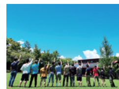
ジュニアユースキャンプ

地域のネットワークを活かして、様々な活動を継続しています。水難事故防止を目指すウォーターセーフティーキャンペーンでは、服を着たまま水の中に落ちた時の体験として「着衣泳」を毎年実施し、近隣の学校への指導者派遣も行っています。